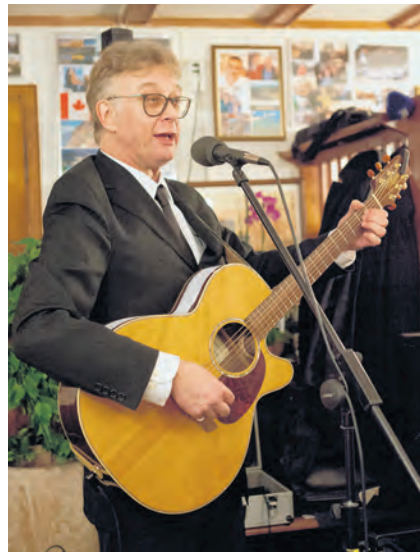
In Aktion. Der Meister kam im Verlauf des Abends immer mehr in Fahrt.

Das Lied ist alles andere als ein Gasenhauer, kommt getragen, ja mitunter fast pathetisch daher. Doch der Funke springt schon nach wenigen Takten aufs Publikum über. Von Strophe zu Strophe wird das erst scheue Mitsingen zumindest beim Refrain kräftiger. Und wer meint, beim Schlussvers «und syg so guet, leg mer in my chalti Hand/der